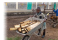
Schubkarre für den Ackerbau

Die AGR ist genauso wie die PSG ein Pfadfinderinnenverband für Mädchen und Frauen. Sie hat wie wir auch knapp 10.000 Mitglieder, von denen die meisten jedoch so arm sind, dass sie keine Mitgliedsbeiträge bezahlen können. Im Gegensatz zur PSG bekommt die AGR keine Zuschüsse von Staat und Kirche, um ihre Projekte und Verwaltung zu finanzieren. Deshalb muss die AGR mit vielen Nichtregierungsorganisationen, wie dem Deutschen Entwicklungsdienst, dem Deutschen Akademischen Austausch Dienst, der Unicef und verschiedenen Pfadfinderinnenverbänden zusammenarbeiten und bei diesen Organisationen Anträge für ihre Projekte stellen. Diese Anträge decken oftmals jedoch nur die Projektkosten ab, nicht aber den Verwaltungsapparat, der auch Kosten verursacht.