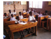
Schulset für eine Schülerin/einen Schüler

Schuluniformen sind in Rwanda Pflicht für alle Kinder die in die Schule gehen wollen oder müssen. Gleichzeitig sind sie aber auch teuer für arme Familien, die um ihr Überleben kämpfen und kaum genug zu Essen haben, geschweige denn Geld um eine Schuluniform zu kaufen. Dein Geschenk gibt einem armen Kind in Rwanda die Chance eine Schule zu besuchen, Bildung zu erlangen und damit den Aufstieg aus der Armut.