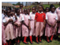
Schuluniform für eine Schülerin/einen Schüler

In zwei kleinen Klassenzimmern betreibt die AGR im Pfadfinderinnenzentrum in Kigali eine kleine Vorschule für Kinder zwischen 3 - 6 Jahren. Die Schulkinder stammen bewusst aus verschiedenen „gesellschaftlichen Schichten“. Beim gemeinsamen Lernen und Spielen sollen Vorurteile zwischen arm und reich abgebaut werden bzw. gar nicht erst entstehen. Schulbildung ist der erste Schritt der Armut zu entfliehen. In Rwanda ist Schulbildung nicht so selbstverständlich wie in Deutschland, deshalb sind die Kinder sehr stolz in die Schule gehen zu können. Die Nachfrage nach den Schulplätzen der AGR ist so groß, dass am Vormittag und Nachmittag Unterricht für verschiedene Klassen stattfindet.