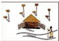
Material für Bananenblatt-Postkarten